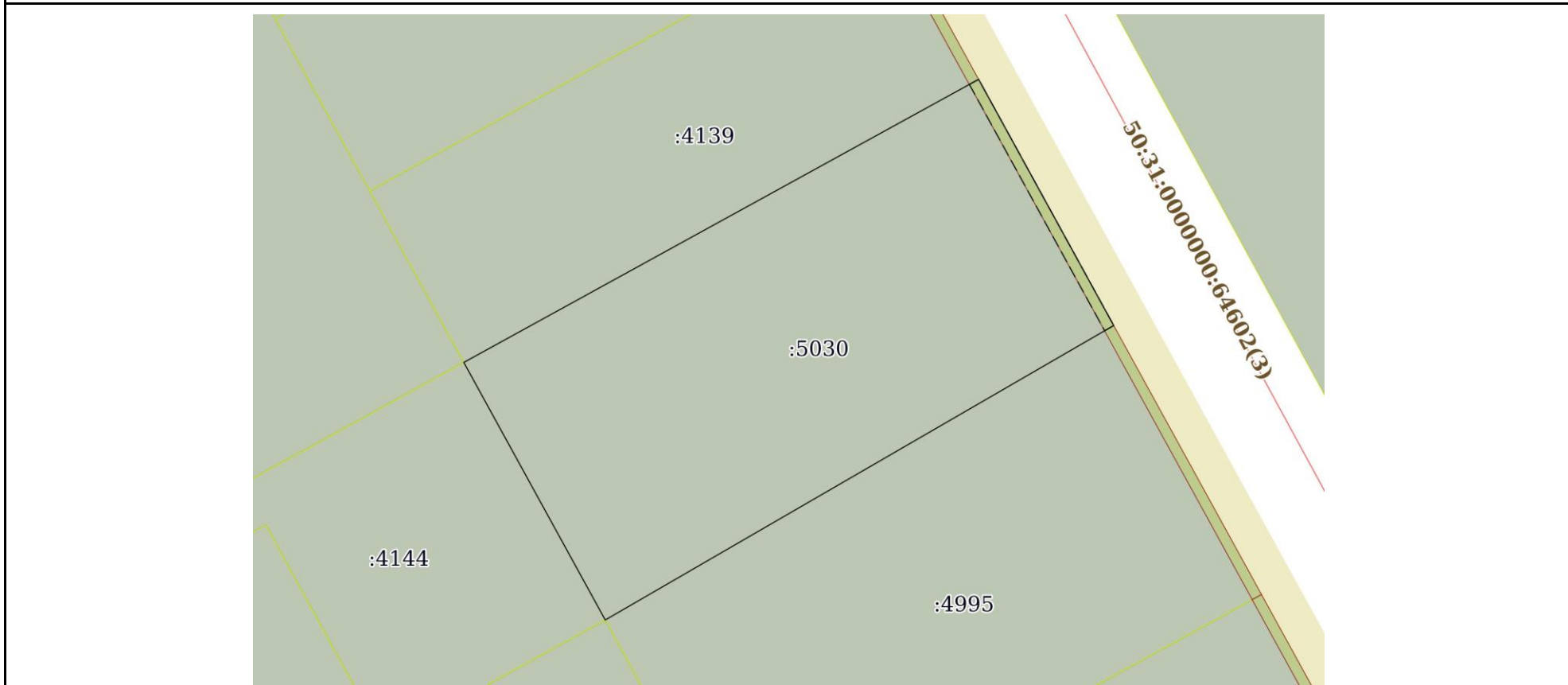
План (чертеж, схема) земельного участка